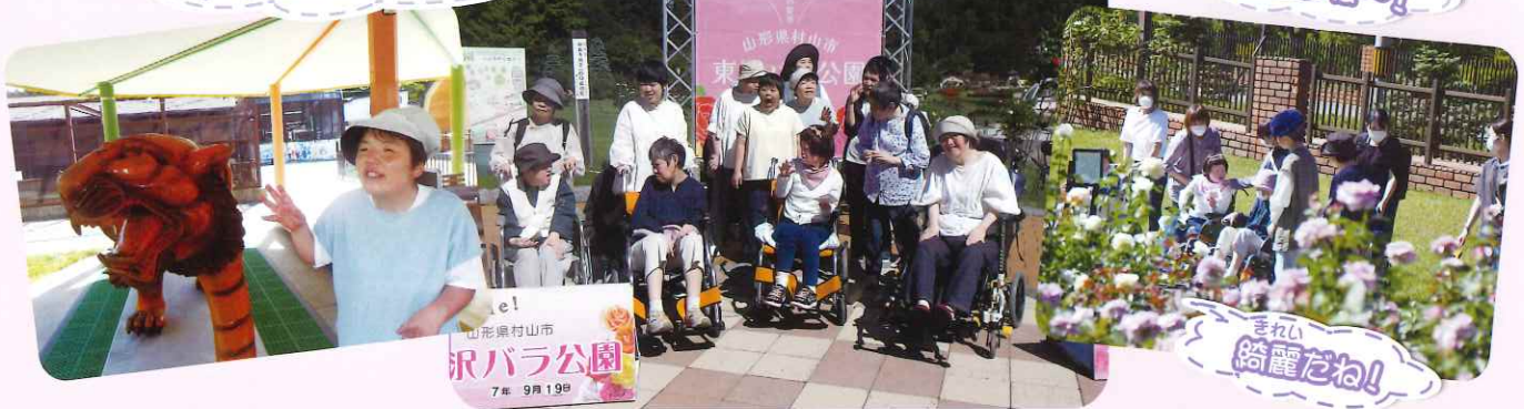
山形県村山市 東沢バラ公園 7年 9月19日