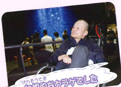
けんもうてき 幻想的なカラダでした