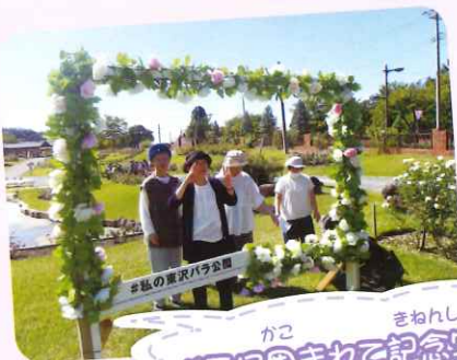
かこ きねんしゃしん バラ園まわって記念写真

ひがしざわ こうえん やちじ どうどうぶつこうえん →コース 東沢バラ公園→チェリーランド→谷地児童動物公園