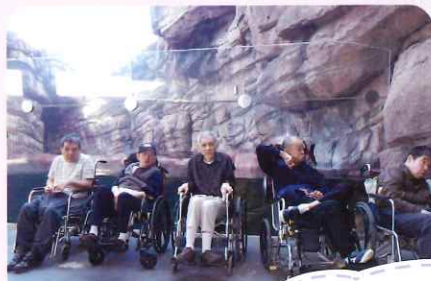
あいぞくかねの 水族館楽しかったですね!