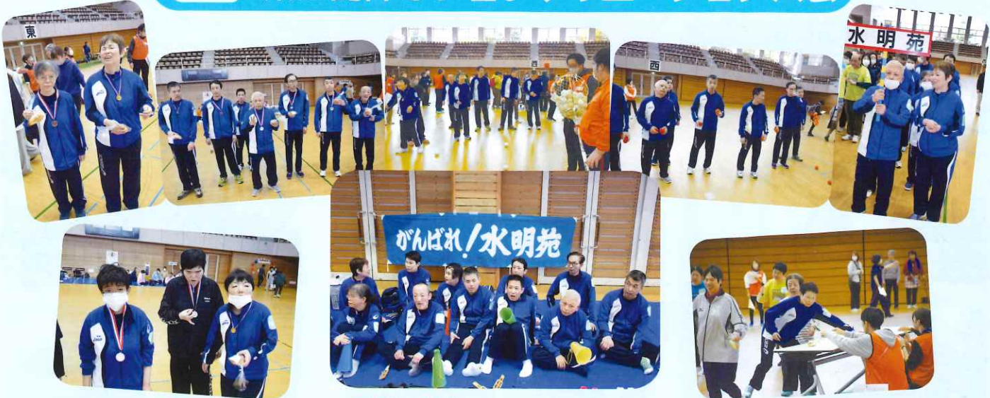
たいがい さんか レクリエーション大会に参加してきました しせつ さんかしゃ おおせいあつ たの いろんな施設から参加者が大勢集まって楽しいレクリエーションでした