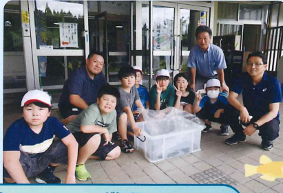
がっ にち おおしだ しょうがっこう おおしだ みなみしょうがっこう おおしだ きたしょうがっこう ぞうてい 7月28日 大石田小学校、大石田南小学校、大石田北小学校にメダカを贈呈しました。