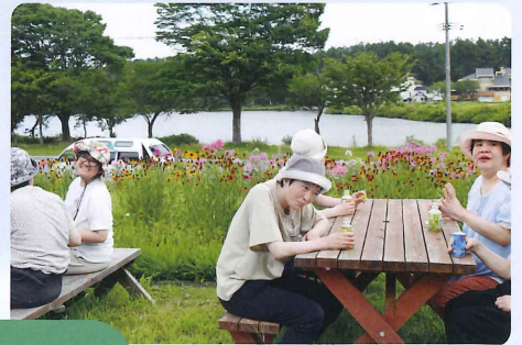
がつ にち りょう 7月21日 もきち・ばしょう寮バスハイク