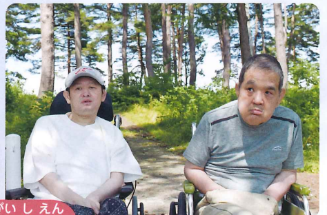
がつ にち か りょうえんがいしえん 7月21日・24日 なんしゅう寮苑外支援