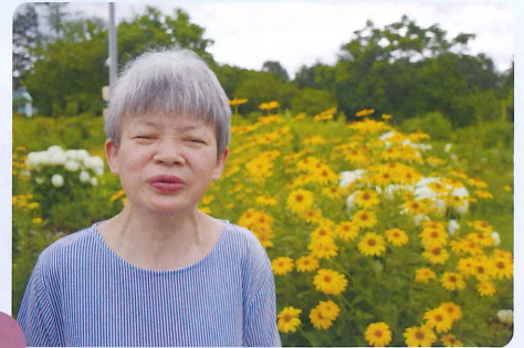
がつ にち りょう 7月12日 しき寮バスハイク