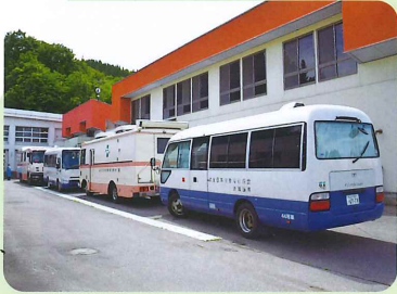
けんしんしゃ き 検診車が来た！