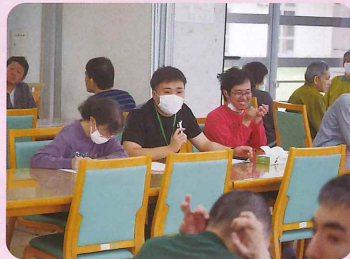
いけん どなたか意見はありますか？