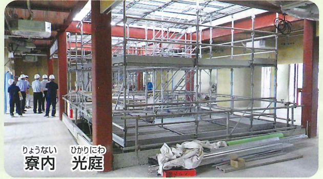
りょうない ひかりにわ 寮内 光庭

けいてんかい すいめいえん 敬天会「水明苑」のホーム ページが新しくなりまし た。工事の状況なども最新 のものをご覧ください。