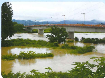
くろたきばし 黒滝橋

8月4日(木)、前日からの豪雨により最上川の水位が上昇し氾濫の危険性があるため、旧最北高等技術専門校体育館へ利用者様と職員全員が避難をしました。 氾濫発生には至らず、施設に被害はありませんでしたが、命を守るための行動ができました。