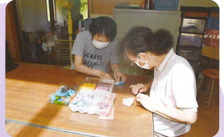
お ここはどう折る？

しゆうそく ねが せんばづる つく コロナ終息を願い千羽鶴を作りました。 か もの い りよこう 「買い物に行きたい」「旅行したい」 きせい たくさん ねが こ 「帰省したい」など、沢山の願いを込めて。