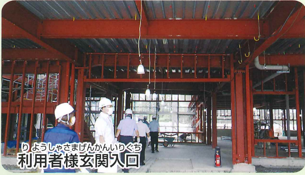
りょうしゃさまげんかんいりぐち 利用者様玄関入口