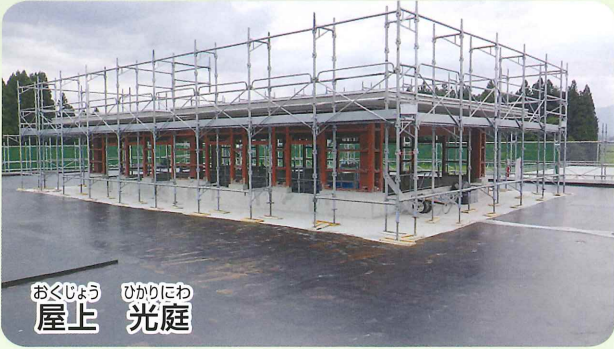
おくじょう ひかりにわ 屋上 光庭