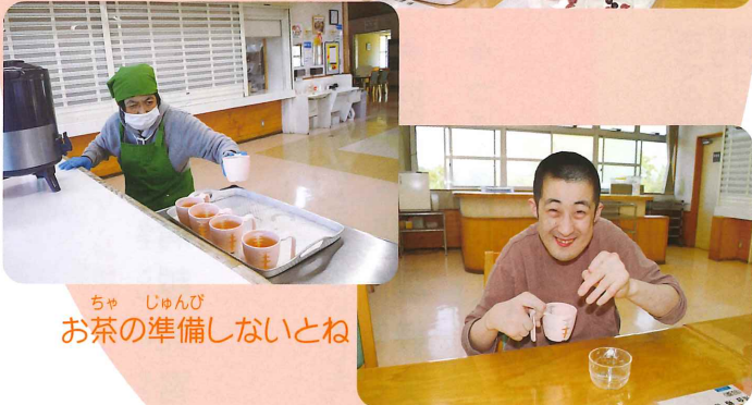
ちゃ じゆんぴ お茶の準備しないとね