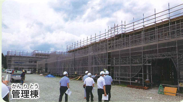
かんりどう 管理棟