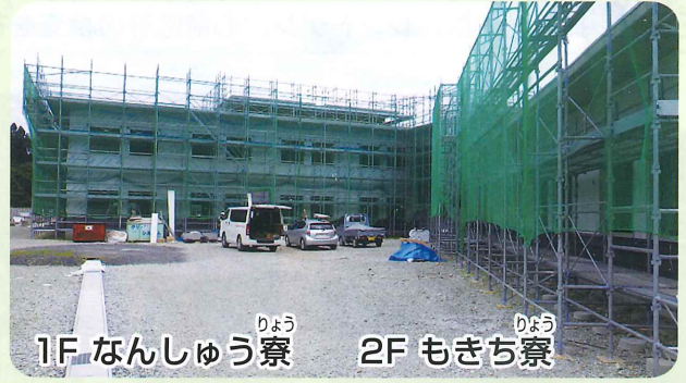
1F なんしゅう寮 2F もきち寮