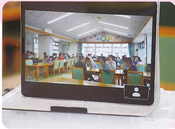
ちゆう オンライン中