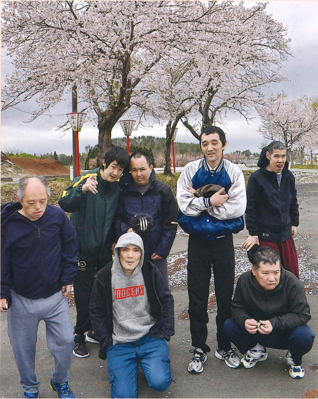
りょう なんしゅう寮