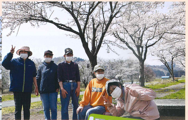
りょう りょう もきち寮・ばしょう寮