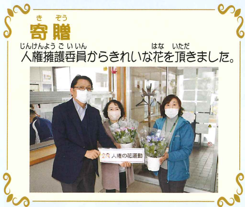
寄贈 人権擁護委員からきれいな花を頂きました。

今後の予定 行事はコロナウイルス感染症防止のため、状況をみて実施していく予定です。 4月から毎月バスハイクを実施しています。