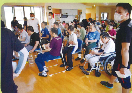
みんなが来るまでまってるよ