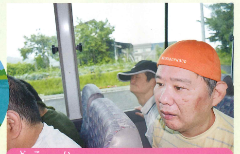
どこい 何処に行くのかな?ワクワク!