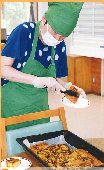
お落とさないように そっと