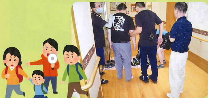
しんちょう 慎重に