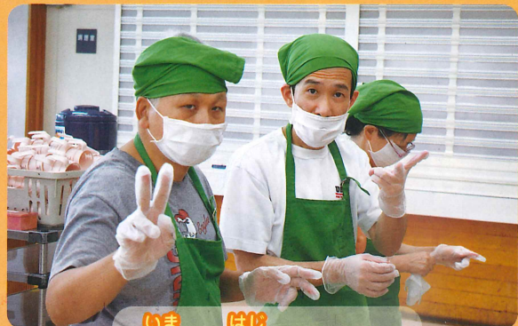
いまはじ 今から始めます!!