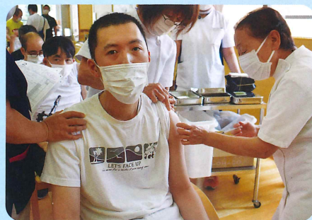
ちゅうしゃこわ 注射怖くない