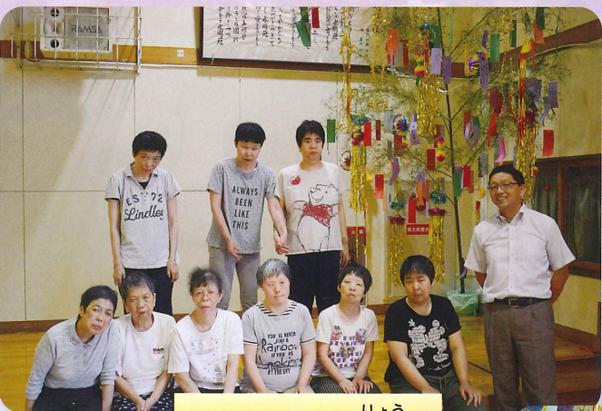
りょう ばしょう寮