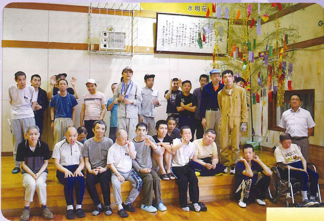
りょう なんしゅう寮