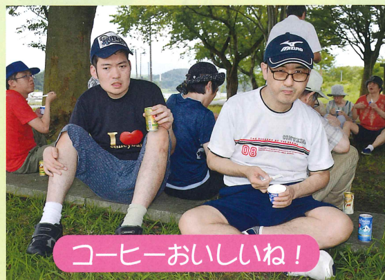
コーヒーおいしいね!