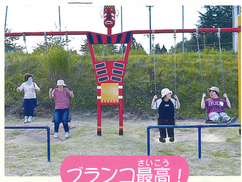
さいこう ブランコ最高!