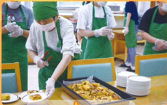
きれいに盛りつけるよ