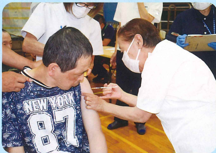
ちゅうしゃ ゆっくり注射してね