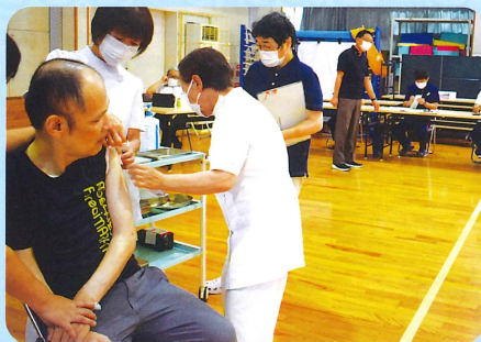
いた痛くしないでね