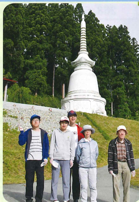
こうせんじ 向川寺にて