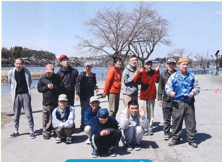
りょう なんしゅう寮