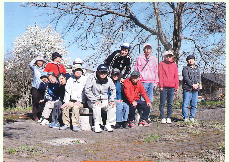
りょう ばしょう寮