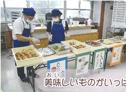
おい 美味しいものがいっぱい！すごくおいしかった！