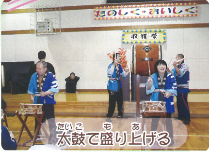
たいこ も あ 太鼓で盛り上げる