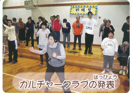
はっぴよう カルチャークラブの発表