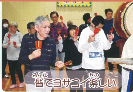
みんな 皆でヨサコイ楽しい