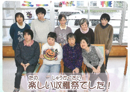
たの 楽しい収穫祭でした！